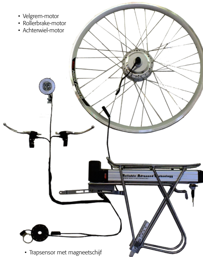
• Trapsensor met magneetschijf