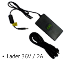
• Lader 36V / 2A